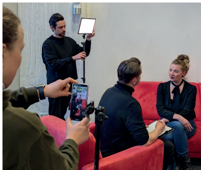
Modernes Equipment immer dabei: Filmdreh eines Interviews

Das BFW Nürnberg qualifiziert Kaufleute für Marketingkommunikation (KMK) und macht sie mit seiner praxisorientierten Ausbildung zu Profis für die Abwicklung von Marketingprojekten.