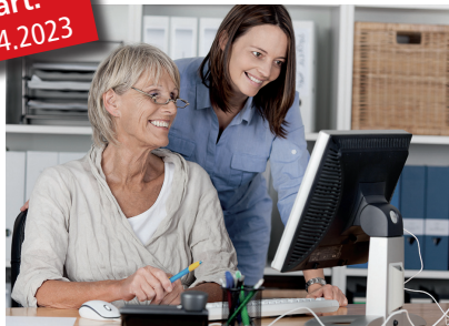
Händeringend gesucht: Fachkräfte im Case- und Belegungsmanagement

Die viels diskutierten Überlastungen in pflegerischen und medizinischen Berufen führen immer häufiger dazu, dass Betroffene ihre Tätigkeit nicht mehr ausüben können. Da viele jedoch die Branche nicht ganz verlassen wollen, ist eine Weiterbildung zum/zur Case- und Belegungsmanager/-in im Gesundheits- und Sozialwesen eine vielversprechende Option.