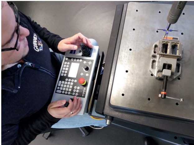
Arbeiten für einen offiziellen Auftraggeber: die Teile, die dieser Teilnehmer vermisst, sichern eine gleichbleibend hohe Qualität der Sehhilfen.

Während ihrer Qualifizierung arbeiten Teilnehmende im BFW Nürnberg immer wieder an realen Aufgaben. Aus diesem Grund kam eine ehemalige BFW-Ausbilderin auf das BFW zu, stellte das Projekt EinDollarBrille vor und warb um eine Zusammenarbeit. Die Idee war, dass angehende Qualitätsfachleute das Messen von Vorrichtungen übernehmen und somit den gemeinnützigen Verein EinDollarBrille e. V. bei der Herstellung der Brillen für Menschen in armen Ländern unterstützen.