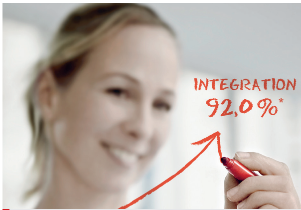
Die aktuelle Quote fürs Reha-Zentrum: 92 %

Grund zur Freude: zwischen 72,4 % und 95,8 % sind erfolgreich integriert