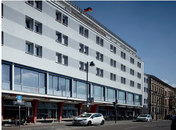
Die Geschäftsstelle in Ansbach

Die von der Agentur für Arbeit Ansbach-Weißenburg ausgeschriebene Maßnahme bbU Reha konnten unsere Außenstellen Ansbach und Roth für sich entscheiden.