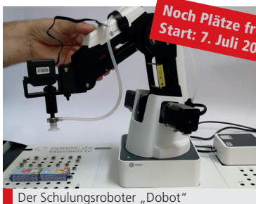
Der Schulungsroboter „Dobot“

Die Industrie sucht vermehrt nach Fachkräften, die an automatisiert gesteuerten Produktionslinien eingesetzt werden können. Um Teilnehmende optimal auf die Anforderungen des Arbeitsmarkts vorzubereiten, führt das BFW Nürnberg im Lernbetrieb metec/Fertigung die Robotik ein.