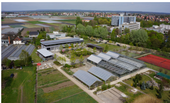
Die Ausbildungsgärtnerei verfügt über insgesamt sieben Gewächshäuser. In einem davon laufen derzeit die Umbaumaßnahmen.

Im Lernbetrieb Blattwerk wird derzeit eifrig in einem der beiden Folienhäuser gearbeitet. Für ein effizienteres Arbeiten mit Saisonpflanzen sind alle angehenden Zierpflanzen-Gärtnerinnen und -Gärtner im Einsatz, befestigte Bodenbeete anzulegen. Die Gärtnerei Blumen Graf aus Nürnberg unterstützt das BFW hierbei mit einer Sachspende und Arbeitskraft.