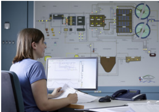
Fachkraft für Abwassertechnik in der Schaltzentrale einer Kläranlage

Eine neue Software zur Simulation der Verfahrenstechnik auf Kläranlagen treibt die Weiterentwicklung in Sachen Digitalisierung auch im BFW-Lernbetrieb abwatec voran.