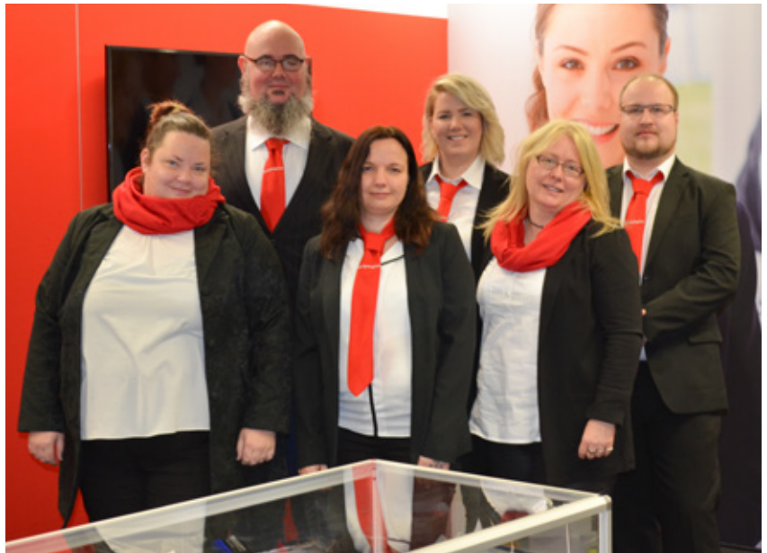
Das Sieger-Team: angehende Industrie- und Großhandelskaufleute sowie Kaufleute im E-Commerce aus dem Lernbetrieb scriptaplus GmbH auf dem hauseigenen Messestand.

Jährliches Highlight im Lernbetrieb scriptaplus GmbH ist die Vorbereitung und Teilnahme an der Übungsfirmenmesse. Erstmals nahmen hierbei neben Teilnehmenden aus den kaufmännischen Ausbildungsberufen für Industrie und Großhandel auch Teilnehmer der neuen Qualifizierung Kauffrau/-mann im E-Commerce teil. Bereits im Vorfeld der Messe stehen Marketinginhalte und Messeschulungen auf dem Stundenplan der Rehabilitandinnen und Rehabilitanden. Gut vorbereitet und unterstützt von kaufmännischen