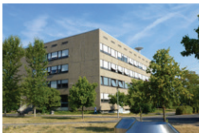
Das Mineralogische Museum in Würzburg

Für das achte unterfränkische Unternehmerfrühstück am 15.11.19 bot das Mineralogische Museum in Würzburg ein perfektes Ambiente. Diesmal trafen sich Unternehmensvertreter und Rehabilitationsträger, um sich zu Themen der Personalentwicklung auszutauschen.