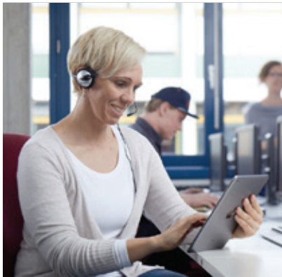
Arbeiten 4.0 - neueste Soft- und Hardware im Einsatz

Die Arbeitswelt verändert sich: Die Entwicklung des Arbeitsmarktes hinsichtlich der Digitalisierung erfordert natürlich auch, dass die berufliche Rehabilitation ihr Portfolio – insbesondere ihre bestehenden Berufsbilder – anpasst. Das BFW Nürnberg startete daher bereits im Frühjahr ein Pilotprojekt zur Vermittlung von Kenntnissen in der Software DATEV.