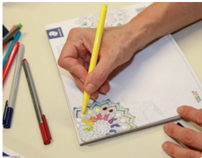
Das Geschenk: Malblock als Mousepad

Seit Beginn der 80er Jahre ist STAEDTLER Mars GmbH & Co. KG Kooperationspartner des BFW Nürnberg. Der Schreibartikelhersteller sponsert hauptsächlich die BFW-Übungsfirma scriptaplus GmbH mit Material für die jährlich stattfindende Übungsfirmenmesse. Nun bekommen erstmals BFW-Teilnehmende direkt die Großzügigkeit des Nürnberger Unternehmens zu spüren.