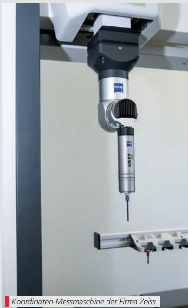
Koordinaten-Messmaschine der Firma Zeiss

Ende Juni 2018 ging es im Lernbetrieb metec für die Qualitätsfachleute um die Wurst: die Abschlussprüfung des ersten Kurses fand für sieben Teilnehmende direkt in ihrem Lernbetrieb metec, in den Räumen des BFW Nürnberg, statt.