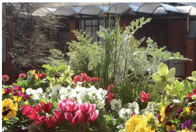
Jedes Jahr erneut eine bunte Pracht: Arrangements in Balkonkästen im Innenhof des Reha-Zentrums

Die Ausbildung im Lernbetrieb Blattwerk ist stark geprägt vom Jahresverlauf. Seit Ende Januar geht es um die Beet- und Balkonpflanzen. Anfang Mai wird es im Verkaufsraum bunt: da startet dann der Verkauf „Buntes Balkonien“ wieder.