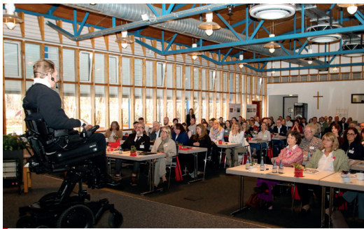
Ein sehr aufmerksames Publikum lauschte dem Vortrag von Samuel Koch in der Aula des Tagungszentrums im bfwhotel.

Die Reha- und Bedarfsträger-Konferenz 2026 fand Anfang März im Tagungszentrum des bfwhotel statt. Höhepunkt war der bewegende Vortrag von Samuel Koch. Die Tagung bot diesmal einen besonders persönlichen Einblick in die Welt der Teilnehmenden.