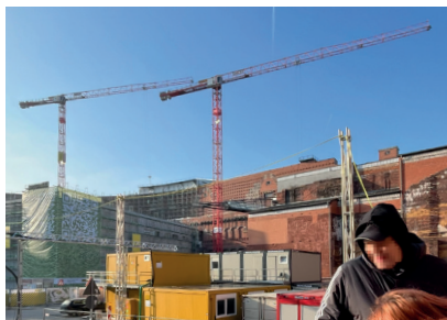
Blick auf den Neubau für das Staatstheater Nürnberg im Zentrum des Kolosseums

Für die Qualifizierung von Bauzeichner/-innen gehören regelmäßige Besuche von Baustellen zum Ausbildungsplan. Theoretische Inhalte aus der Ausbildung werden so mit der baulichen Praxis verknüpft, um das Verständnis für die Umsetzung von Zeichnungen zu entwickeln.