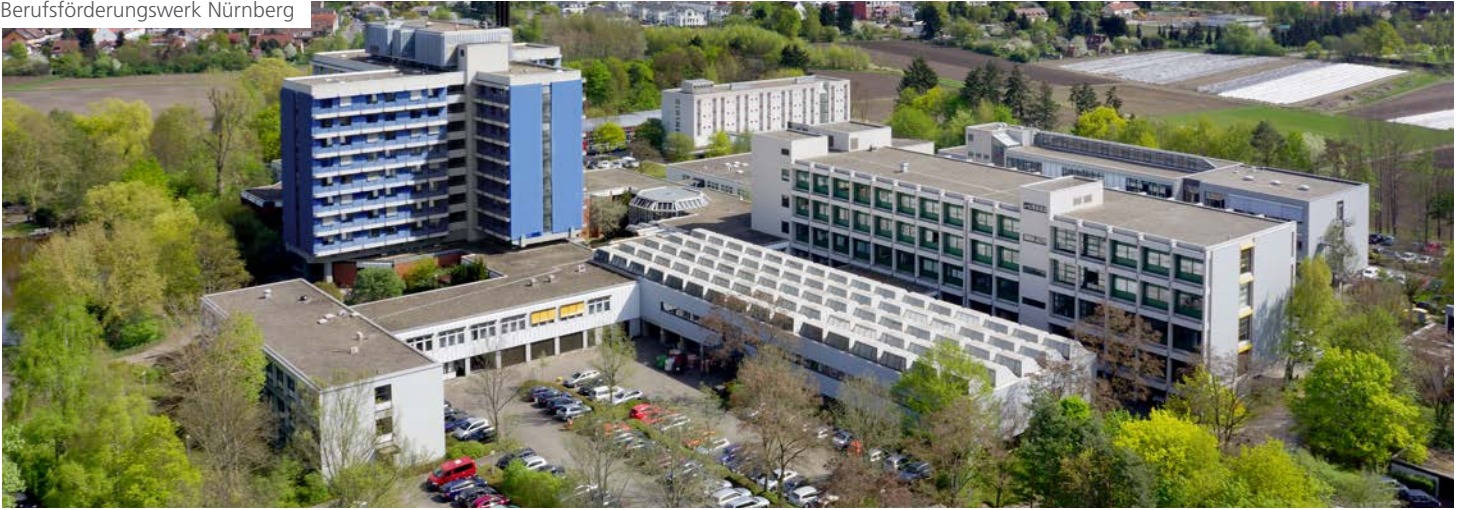
Das Berufsförderungswerk Nürnberg liegt am grünen Rand von Nürnberg im Stadtteil Wetzendorf.