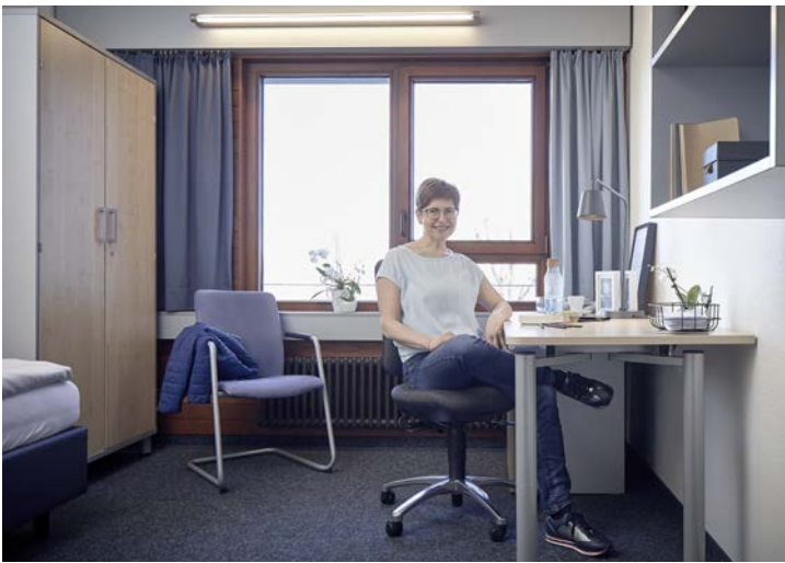
In unserem Wohnbereich auf dem Gelände des BFW Nürnberg stehen Ihnen attraktive Einzelappartements zur Verfügung.