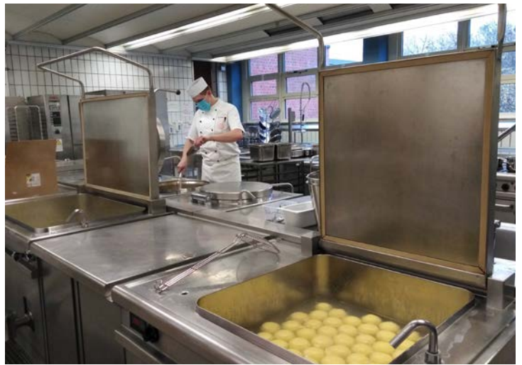
Alle unsere Teilnehmenden erhalten eine Vollverpflegung aus der BFW-Küche.